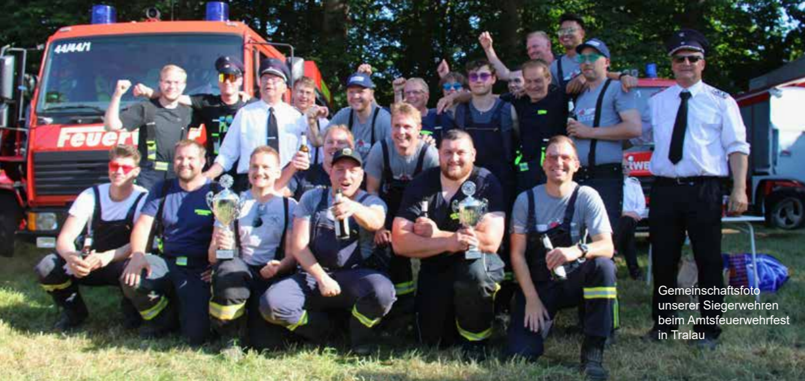
Gemeinschaftsfoto unserer Siegerwehren beim Amtsfeuerwehrfest in Tralau